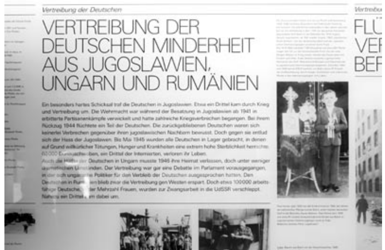
Magyar vonatkozású tábla a kiállításon

rem tele emberrel. Kétszer jártam ott. Megindultság, fájdalom az arcokon. És talán némi tiszteletet. Noha a kiállítás az 1919–20-as törökországi örmény népirtással kezdődik, és sorra veszi a „kikényszerített utak”-at egészen a délszláv háborúig, elsősorban a II. világháború után földjükről elűzöttekről szól.