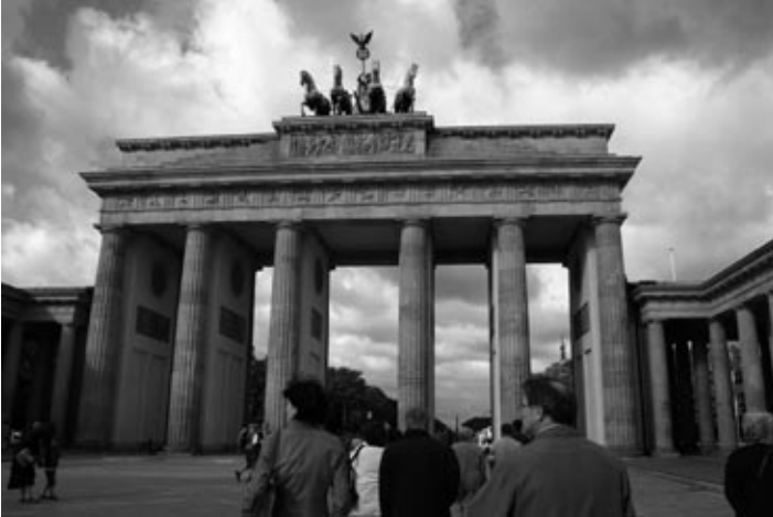
A Brandenburi kapu