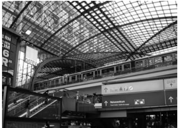
Az új központi pályaudvar belső tere

gel hallottam valamelyik magyar rádió adásában, hogy ezentúl rácsok védik majd a budapesti Nyugati pályaudvart a hajléktalanoktól, lebzselőktől. Belépni csak érvényes jeggyel lehet. Hát, vannak különbségek. Éjfél felé jár, amikor nézegetjük a hatalmas közlekedési centrumot. Lehet tudakozódni, jegyet venni, enni, inni. Működik az újságos stand, van hol internetezni. Sehol egy rendbontó. Kicsit talán túl nagy az egész. A brüsszeli reptér és főpályaudvar meg a római Termini is beleférne. S mint Nyugat-Európában annyi helyen, itt is lenyűgöz, hogy a nemzetközi vonatokhoz ki van jelölve a helyjegynek megfelelő beszállási pont a vonatajtónál.