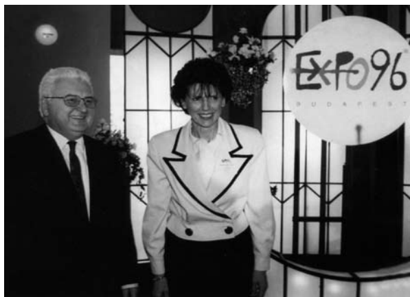
Boross Péter miniszterelnökkel 1994 februárjában

– Hol tartunk most a Duna Stratégia megvalósításában? Mik a tennivalók? Mi a feladatunk az uniós elnökségünk idején?