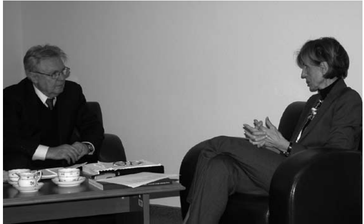
A beszélgetésen részt vett az Európai Utas főszerkesztője is

– Szóltam már a Dunához kötődő személyes vonzalmamról, és sokat tudnék arról is beszélni, hogy a Duna Stratégiában nem csak gazdasági, infrastrukturális és környezetvédelmi kérdések vannak. Saját tapasztalataimból, utazásaimból tudom azt, mit jelent e térség sokszínűsége, a kultúrák keveredése. Beszélhetnék a Duna menti szőlőkultúráról, a wachau fehér, és a szekszárdi vörös borokról, az osztrák, a szlovák, a délszláv művészetekről, kulináriáról, Gemenc egyedülálló ökológiai világáról. Meggyőződésem, hogy az együttműködés lehetőséget ad arra, hogy megmutassuk a világnak a hidakat, az apátságokat Regensburgtól Bulgáriáig, azt, hogy a sok